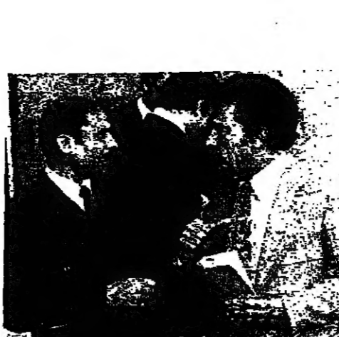
ترأس الرئيس الياس سركيس اجتماع عمل قبل ظهر امس في القصر الجمهوري في بعبدا حضره كل من وزير الداخلية الدكتور صلاح سلمان ، وزير الاشغال العامة المهندس امين البزري ، قائد قوات الردع العربية المقدم سامي الخطيب ،